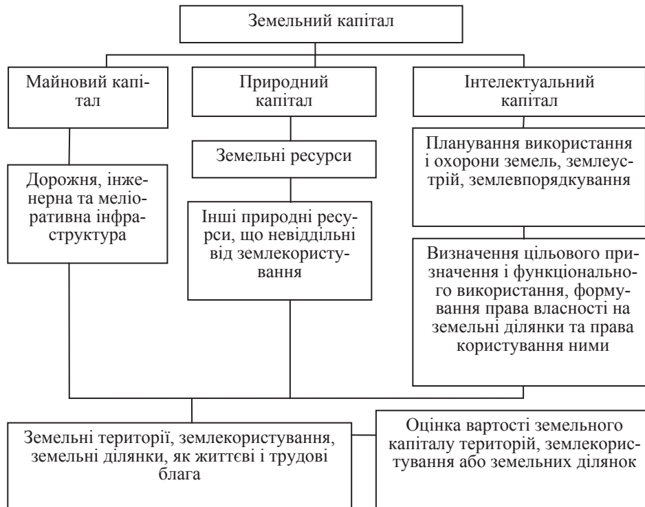
Рис. 3. Логічно-розумова модель структури методології формування земельного капіталу.

тих природних процесів, які відбувалися і без неї.