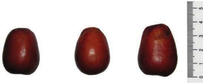
Рис. 1. Плоди унабі. Сорт Та-Ян-Цзао. Хорол, 2013 р.

та плодоносять інші середньоплідні сорти унабі інтродукованих нами із АР Крим та Запорізької області.