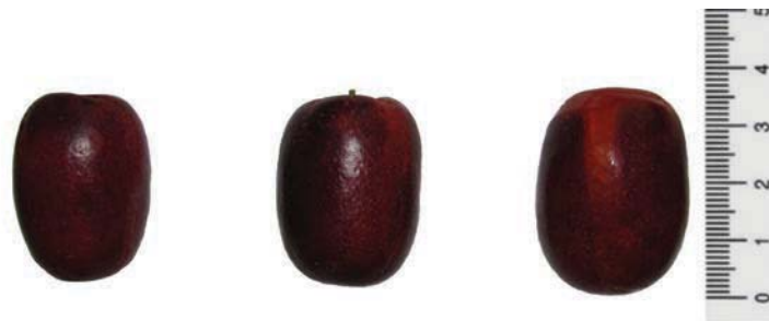
Рис. 2. Плоди унабі. Сорт Вахиський. Хорол, 2013 р.

Для зизифуса справжнього, як і інших деревних та кущових плодкових культур при виробництві сортового посадкового матеріалу, застосовується вегетативний спосіб розмноження, що базується на здатності окремої частини сортової рослини, а саме бруньки або частини стебла, щепленої на дрібноплідний сіянець відтворювати гілкування сортової рослини.