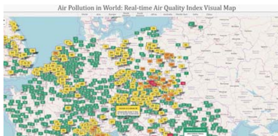
Рис. 1. Приклад представлення інформації на сайті http://aqicn.org [13]

Приклад представлення інформації на сайті http://aqicn.org представлено на рис. 1 [14].