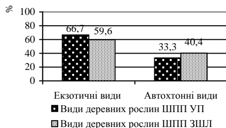
Рис. 3. Розподіл видів дендрофлори ШПП частин УП і ЗШЛ РО відповідно до їхнього походження

На територіях ШПП РО виявлено як екзотичні (77 видів), так і автохтонні (38 видів) види деревних рослин. У зв'язку із цим аналіз географічної структури дендрофлори проводився для кожної фракції окремо.