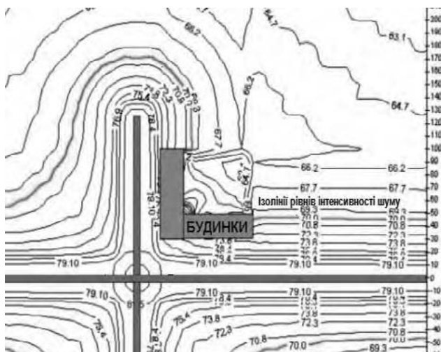
Рис. 1. Ізолінії розповсюдження рівня звуку (дБА) на перехресті 2-х автомагістралей з урахуванням впливу забудови території