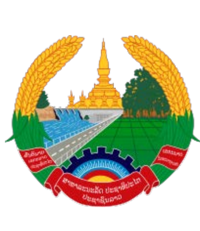
Рис. 3. Герб Лаосу (техногенна складова частина)