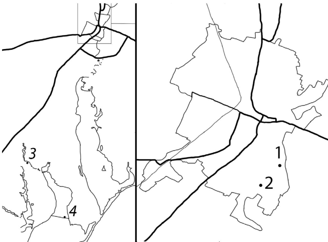
Рис. 2. Карта розташування точок збору молюсків в регіоні (зліва) і на території міста (справа)

в (табл. 2). Отримані результати демонструють, що в різних біотопах метричні значення варіюють. Параметри раковин наземних молюсків можуть визначитися характером середовища існування. Мінливість морфометричних ознак наземних молюсків може мати географічну спрямованість. Останнє обумовлено кліматичними умовами різних зон регіону. Відмінності за метричними параметрами ймовірно є слідством впливу умов проживання (Хлус, 2010-2013). Збільшення мінливості багатьох параметрів говорить про нестабільність умов існування популяції.