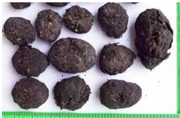
Рис. 1. Морфологические особенности погадок Tyto alba

Жертвами сипухи стали представители 3 отрядов ( Lipotyphla , Rodentia , Carnivora ), 10 родов и 11 видов млекопитающих. Несмотря на разновеликие выборки, частоты встречаемости большинства особей видов – основных пищевых объектов сипухи по нашим данным и сведениям [9] в значительной степени совпадают (табл. 1, выделено). Это обусловлено схожестью биотопов и высокой численно-