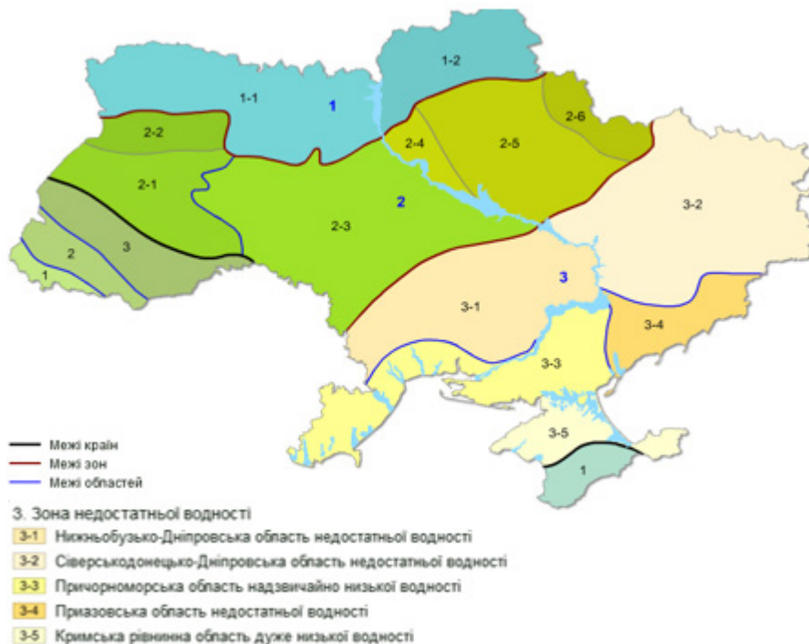
Рис. 2. Карта-схема гідрологічного районування України [13]

Для розрахунку показника Md було визначено суму середньодекадних дефіцитів вологості ґрунту, яка в середньому для умов станції Велика Олександрівка становить 1 475 мм. Середньобаторічне значення критерію Md становить 0,22, що характеризує