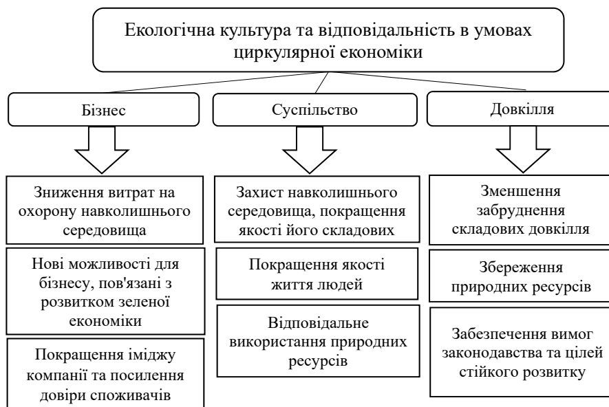
Рис. 2. Основні переваги впровадження екологічної культури та відповідальності в умовах циркулярної економіки

Ці дані свідчать про зростаючу тенденцію усвідомлення та інтеграції стійкого розвитку в українському бізнесі, а також про збільшення кількості компаній, які публікують звіти у цій сфері.