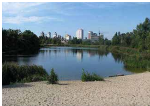
Рис. 2. Район розташування оз. Буревісник-Корольок у Дарницькому районі м. Києва