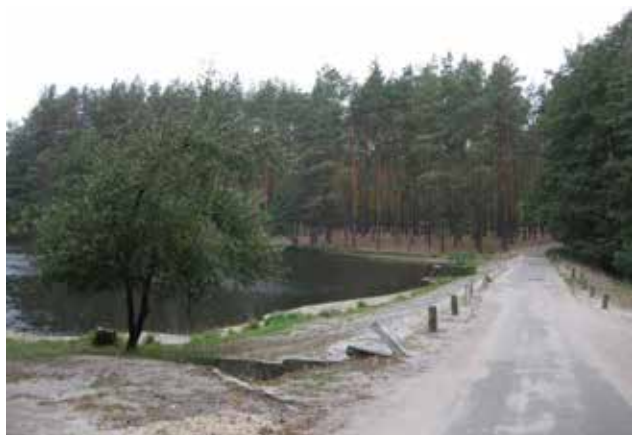
Рис. 3. Район розташування ставка Миський у Оболонському районі м. Києва (фото дамби із транспортним проїздом)

Особливість озер полягає в тому, що у прибутковій частині їх водного балансу помітну роль відіграють поверхневі дощові та талі стічні води [2]. Озера системи Опечень не мають прямого гідравлічного зв'язку з р. Дніпро, проте їхній гідрологічний режим змінюється залежно від коливання водності Дніпра внаслідок зміни рівня ґрунтових вод на всій заплавної терасі. Ланцюг озер Опечень – це своєрідний колектор. Пройшовши систему озер, вода з Йорданського озера потрапляє до Канівського водосховища. Сумарне надходження зливових та природних вод до водосховища за оцінками спеціалістів [2] сягає до 13,2 млн. м 3 /рік. У озерах відбуваються процеси природного доочищення дощових вод із прилеглих територій, а тому їх збереження важливе для стійкості екосистеми Дніпра. Благоустрій прибережних смуг та акваторій оз. Йорданське та Кирилівське окрім зміни морфометричних параметрів водойм за рахунок днопоглиблення та розчищення передбачав забір води для поливу паркової зони, експлуатацію