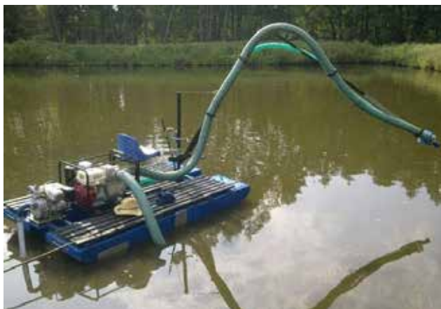
Рис. 7. Фотофіксація міні-земснаряду на акваторії ставка Миський у Оболонському районі м. Києва