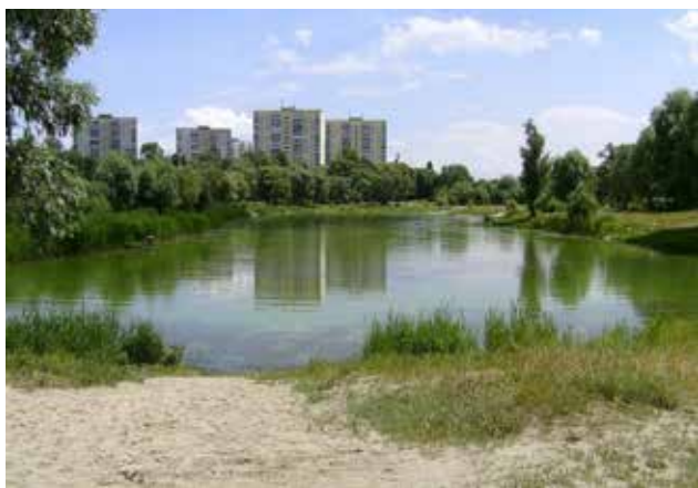
Рис. 1. Район розташування оз. Синє у Подільському районі м. Києва

Задача поліпшення санітарного стану оз. Буревісник-Корольок (рис. 2) була окреслена як одна із задач охорони і раціонального використання вод-