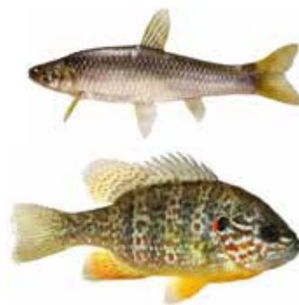
Рис. 6. Види іхтіофауни, масове розмноження яких свідчило про розвиток деградаційних процесів

Дослідженнями вмісту у воді розчиненого кисню за сезонами року виявлено чітке зниження цього показника у період, коли розпочинається саме масове збільшення кількості синьо-зелених водоростей. Для цього періоду (квітень-вересень) є характерним також незначне зменшення кількості діатомових і збільшення зелених водоростей. Отримані дані свідчать про те, що саме синьо-зелені водорості є причиною забруднення міських водойм влітку. Для досліджуваних водойм такі показники якості води, як біохімічна потреба кисню (БПК), хімічне споживання кисню (ХСК) та азот амонійний (NH 4 ), перевищували регламентовану норму у 5–6 разів в холодний період року та у 15–20 разів у теплий період року. Візуально по усіх водоймах у період масового розмноження синьо-зелених водоростей спостерігали пригнічення вищої водної рослинності. Одним із факторів незадовільного стану водойм було зменшення кількості виловлених представників окремих видів іхтіофауни, зокрема, окуня звичайного ( Perca fluviatilis ), карася сріблястого ( Carassius gibelio ), що свідчило про зменшення чисельності їх популяцій. При цьому чисельність популяцій таких небажаних для міських водойм видів іхтіофауни, як сонячний окунь ( Lepomis gibbosus ) та амурський чебачок ( Pseudorasbora parva ) (рис. 6), зростала із року в рік.