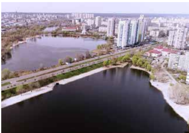
Рис. 5. Аерофотознімок панорами озер Йорданське та Кирилівське у Оболонському районі м. Києва

поверхневого водозабору та насосної станції технічного водопостачання.