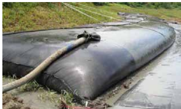
Рис. 8. Фотофіксація геотуб у прибережній зоні ставка Горащиха, де здійснювали зневоднення та висушування суміші земляних та мулових мас

берегової лінії міських водойм Києва дозволило не лише отримати велику партію однорідного за складом матеріалу, але і не допустити погіршення якості води. Геотуби здатні видаляти нафтопродукти з води шляхом їх накопичення у стінках, геосинтетичні матеріали завдяки своїй текстурі і способу виробництва виступають свого роду фільтром, хімічно стійким до нафтопродуктів [7].