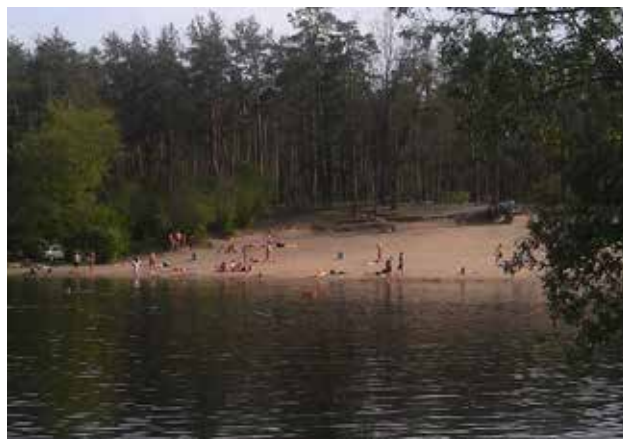
Рис. 4. Район розташування ставка Горащиха у Оболонському районі м. Києва (фото пляжної зони)