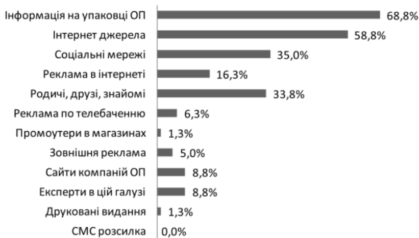
Рис. 6. Джерела інформації про органічну продукцію

Перспективи використання результатів дослідження. Окрім забезпечення нас якісними та безпечними сертифікованими органічними продуктами харчування, наш вибір сприятиме протидії основним екологічним проблемам: зміні клімату, втраті біорізноманіття та екосистемних послуг, деградації земель, забрудненню повітря, води, ґрунту тощо; розвитку сільських територій, підвищенню зайнятості і добробуту населення.