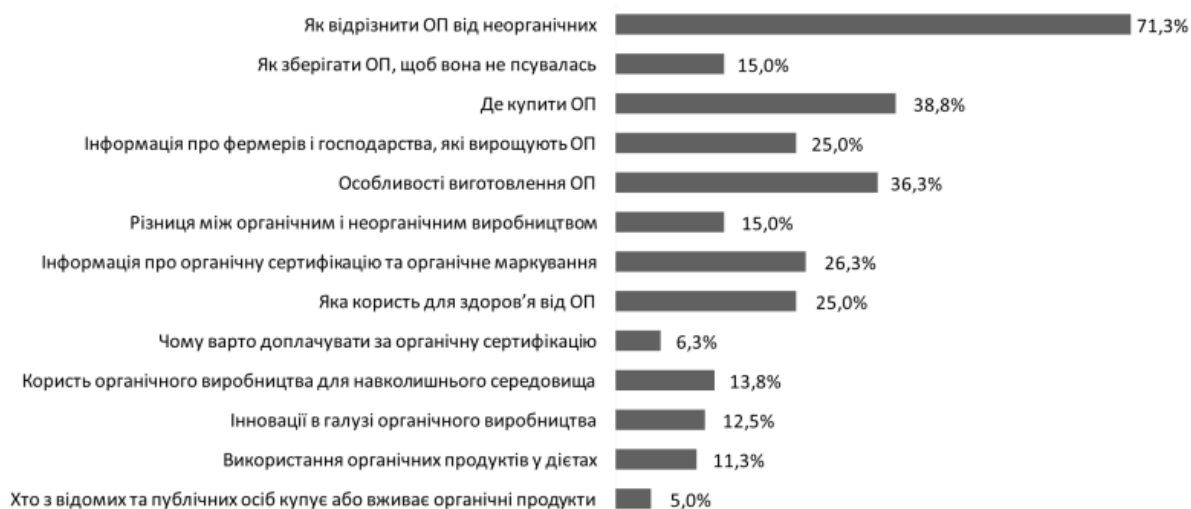
Рис. 2. Інформаційні потреби цільової аудиторії про органічну продукцію