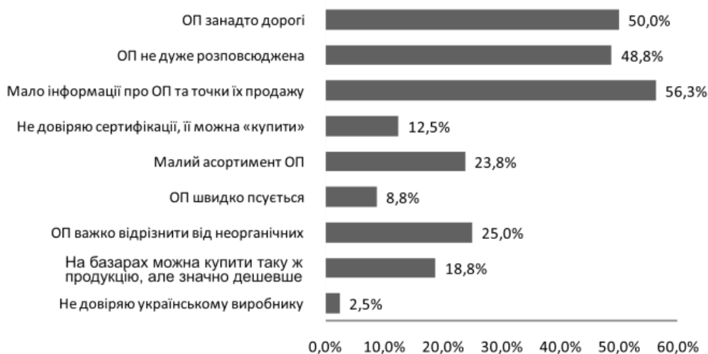
Рис. 7. Недоліки органічного виробництва та продукції