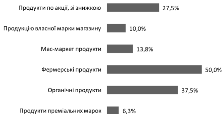
Рис. 3. Купівля органічних продуктів у порівнянні з іншими категоріями