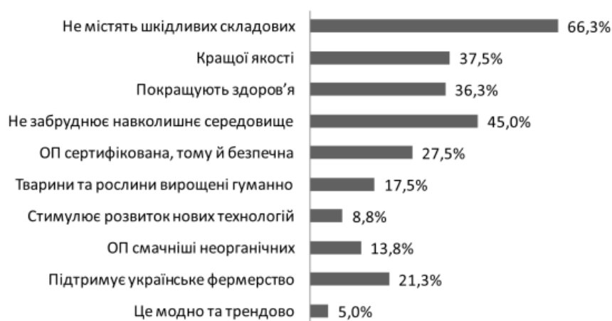
Рис. 4. Переваги органічного виробництва (з підказкою)