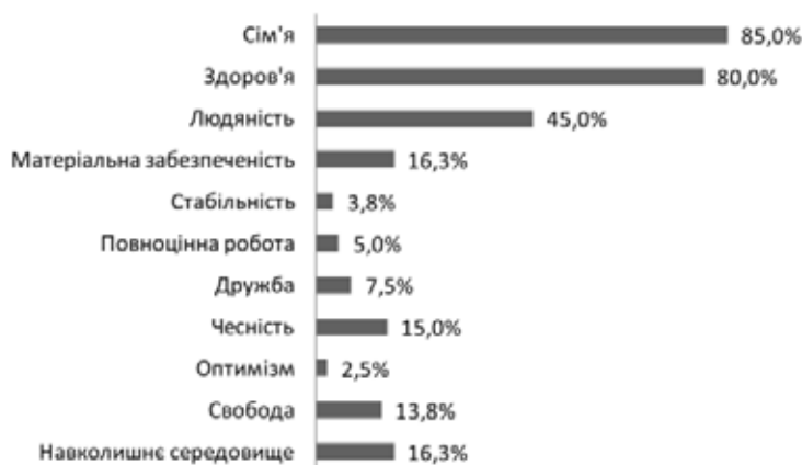
Рис. 1. Загальні цінності цільової аудиторії

Ті, що купують часто, і ті, що рідко – врівноважують один одного в межах 30%. 22,5% важко відповісти, а дуже часто купують 7,5% опитаних.