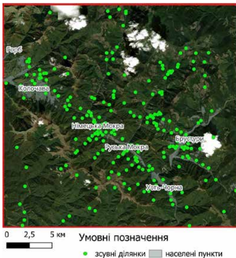
Рис. 1. Територія досліджень з нанесеними зсувними ділянками

Базовим набором вихідних даних слугувала цифрова модель рельєфу ALOS AW3D30 (JAXA) з просторовою роздільною здатністю близько 25–30 м, яка була приведена до єдиної проєкції та обрізана за межами досліджуваної території. На основі ЦМР було розраховано ключові морфометричні параметри рельєфу, що безпосередньо впливають на формування та активізацію зсувних процесів. Крутизна схилів (Slope), обчислена у градусах, використана як один із головних факторів гравітаційної нестійкості схилів. Для врахування нелінійного характеру впливу крутості на розвиток зсувів застосовано гау-