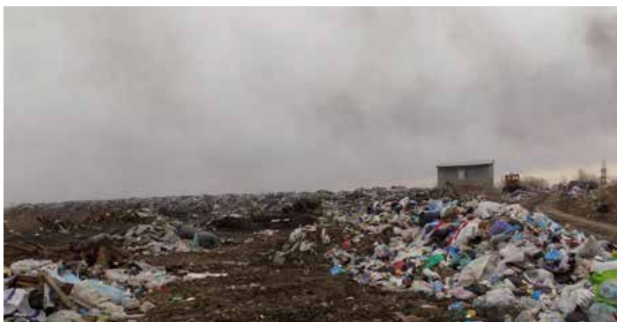
Рис. 1. Загальний вигляд території полігону твердих побутових відходів міста Борислав із хаотично розміщеними відходами

Проведений у науково-дослідній лабораторії екологічної безпеки Львівського державного університету безпеки життєдіяльності, аналіз вмісту іонів важких металів у едафотобах, засвідчив формування чітко вираженого просторового градієнта техногенного забруднення залежно від відстані до тіла полігону. Найвищі концентрації іонів Pb, Zn та Cu зафіксовано у приполігонній зоні (50-100 м), що є характерною ознакою тривалого впливу досліджуваного об'єкту в умовах відсутності передбачених нормами інженерно-захисних бар'єрів (рис. 2)