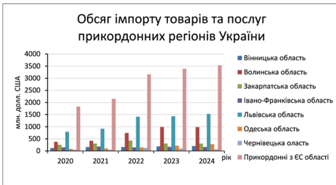
Рис. 3. Обсяг імпорту товарів та послуг у грошовому еквіваленті прикордонних регіонів України

Серед міжнародних проєктів Асоціації транскордонного співробітництва «Євро регіон Нижній Дунай» особливе значення мають ініціативи у сферах водної інфраструктури, охорони здоров'я та екологічного моніторингу. У сукупності вони засвідчують, що транскордонне співробітництво є дієвим механізмом досягнення ЦСР через поєднання інфраструктурних, соціальних, освітніх та екологічних складових розвитку.