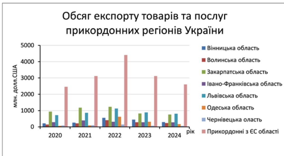
Рис. 2. Обсяг експорту товарів та послуг у грошовому еквіваленті прикордонних регіонів України

Важливе місце посідають також спільні освітні та наукові проєкти. Прикладом є проєкт “Establishment of Learning Network for the consolidation effort of joint environmental control and monitoring in the Black Sea Basin 2 (Створення навчальної мережі для консолідації зусиль спільного екологічного контролю та моніторингу Басейні Чорного моря 2)”, спрямований на розвиток екологічного контролю, моніторингу та екологічної освіти в Чорноморському регіоні [29]. Одним із його партнерів був Національний університет «Одеська політехніка», діяльність якого була пов'язана з розробленням освітніх ресурсів, підвищенням рівня екологічної обізнаності та підтримкою функціонування платформи LeNetEco. Організаційну підтримку таким ініціативам забезпечують міждержавні асоціації, зокрема Асоціація транскордонного співробітництва «Єврорегіон Нижній Дунай», основні проєкти якої наведено в табл. 1.