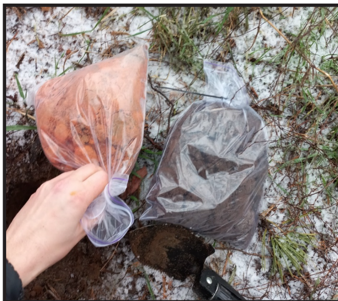
Рис. 3. Відібраний зразок ґрунту і візуальне його порівняння із фоновим зразком, який відібраний приблизно за 2 км.