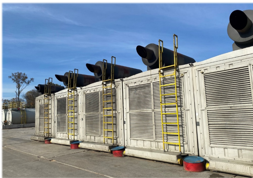
Рис. 4. Автономні дизель-електричні станції сучасних бурових установок

Мінімізує негативний вплив на довкілля те, що в АТ «Укргазвидобування» не використовується нафта у якості змащувальної добавки, за виключенням окремих випадків та під час встановлення нафтових ванн з метою ліквідації прихоплення бурильної колони. Але при цьому, після ліквідації аварійної ситуації «пачку» нафтової ванни вилучають з циркуляції для її повторного використання на інших свердловинах.