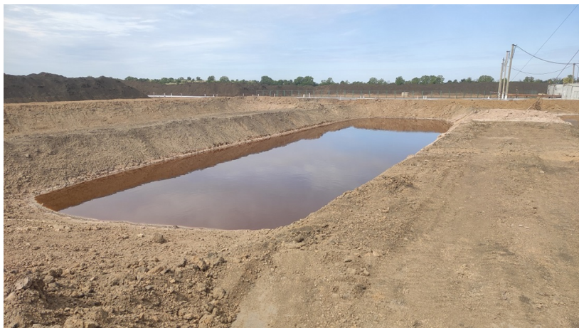
Рис. 5. Шламовий амбар свердловини № 580 Західно-Хрестищенського ГКР з протифільтраційним екраном з ПАА та глини

В результаті цих заходів, нафтопродукти в шламових амбарах на більшості свердловин відсутні (рис. 3, 5).