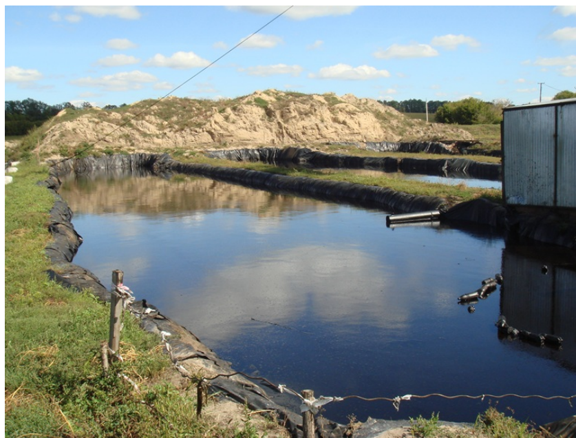
Рис. 2. Шламові амбари на майданчику свердловини №125 Рудівсько-Червонозаводського ГКР.