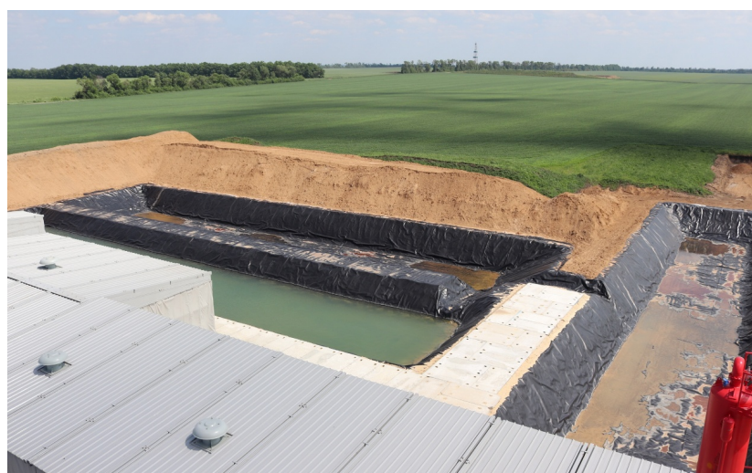
Рис. 3. Сучасний протифільтраційний екран з геомембрани HDPE

На рис. 2 зображено три шламові амбари, водна поверхня яких вкрита суцільною плівкою нафтопродуктів (далі – ПММ). Ці ПММ потрапили в амбари через використання застарілого обладнання, виро-